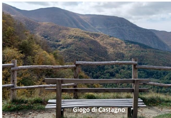
Giogo di Castagno

L'escursione si svolge nella foresta e sul crinale compreso fra il paese di Castagno d'Andrea e il Passo del Muraglione . Siamo nel comune di San Godenzo , al confine orientale del Parco Nazionale delle Foreste Casentinesi , Monte Falterona e Campigna . Il Parco è formalmente operativo dal 1993. Castagno d'Andrea , da cui partiremo, deve il suo attuale nome al pittore Andrea di Bartolo di Bargilla , detto Andrea del Castagno (Castagno, 1421 – Firenze, 1457). Il paese che vediamo oggi è stato in gran parte ricostruito dopo la distruzione del 1944. Il paese è posto alle pendici del Falterona, monte particolarmente instabile, soggetto di molte frane; terribile quella del 15 maggio 1335. Scrive Giovanni Villani , nella sua Nuova Cronica ... una falda de la montagna di Falterona ... per tremuoto e rovina scoscese più di quattro miglia infino a la villa che si chiamava il Castagno, e quella con tutte le case, persone a bestie salvatiche e dimestiche e alberi sobissò, e assai di terreno intorno..(omissis).. e gittò infinita quantità di serpi, e due serpenti con quattro piedi grandi com'uno cane, li quali l'uno vivo e l'altro morto fuoron