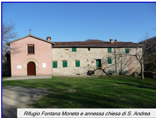
Rifugio Fontana Moneta e annessa chiesa di S. Andrea

crinale, numerosi saliscendi, punti panoramici, attraversando boschi di latifoglie, bosco ceduo, boschetti di abete e pino e suggestivi castagneti. Partiremo dal Rifugio Fontana Moneta (634 m.), su stradello che costeggia dall'alto il torrente Sintria, fino ad arrivare nei pressi del monte Toncone (813 m.) per raggiungere poi, per crinale Pian di Volpone (724 m.), che si affaccia sulla valle del Senio. Proseguiamo su crinale, per poi scendere al torrente Sintria, attraversando un bellissimo castagneto, dal quale è possibile ammirare in lontananza la Vena del Gesso romagnola. Risaliamo fino alla chiesetta di Fornazzano (604 m.) e per abetina fino ai ruderi del Castello di Fornazzano (725 m.). Proseguendo per punti panoramici raggiungiamo la strada che si affaccia sulla valle del Lamone, che percorriamo in direzione Cà Malanca (720 m.), presso il museo dove sono custodite testimonianze della seconda guerra mondiale. Ritornando sui nostri passi riprendiamo il sentiero, nei pressi di un'edicola raffigurante il Beato Frassati, per raggiungere la località Croce Daniele (689 m.). Ci attende ora il tratto conclusivo della nostra escursione che attraversando un castagneto ci conduce in discesa fino al guado del torrente Sintria (550 m.), superato il quale affrontiamo una breve ripida salita che ci riporta al punto di partenza.